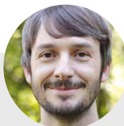
Ingo Effing Redaktion Test & Technik

Telefon: 0 22 03/35 84-167 katharina.garus@radtouren- magazin.com