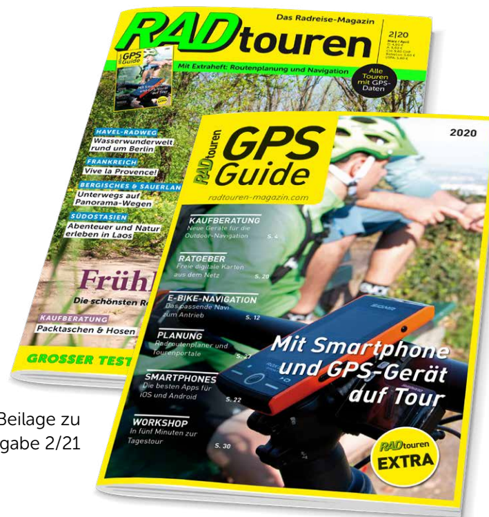
Beilage zu Ausgabe 2/21

Ihr Produkt bzw. Ihre Region kann dabei sein: als Advertorial oder als Anzeige.