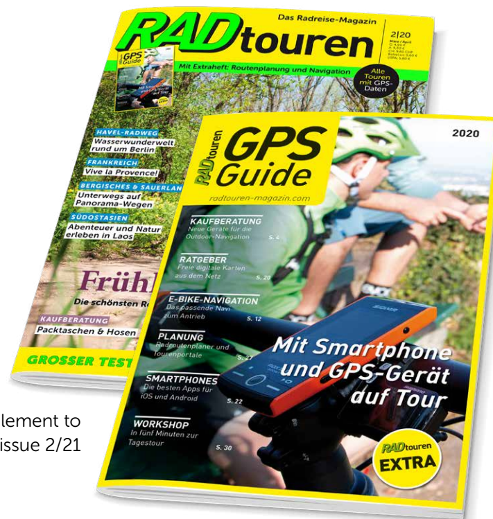
Supplement to issue 2/21

Your product or your region can be part of it: via an advertorial or an ad.